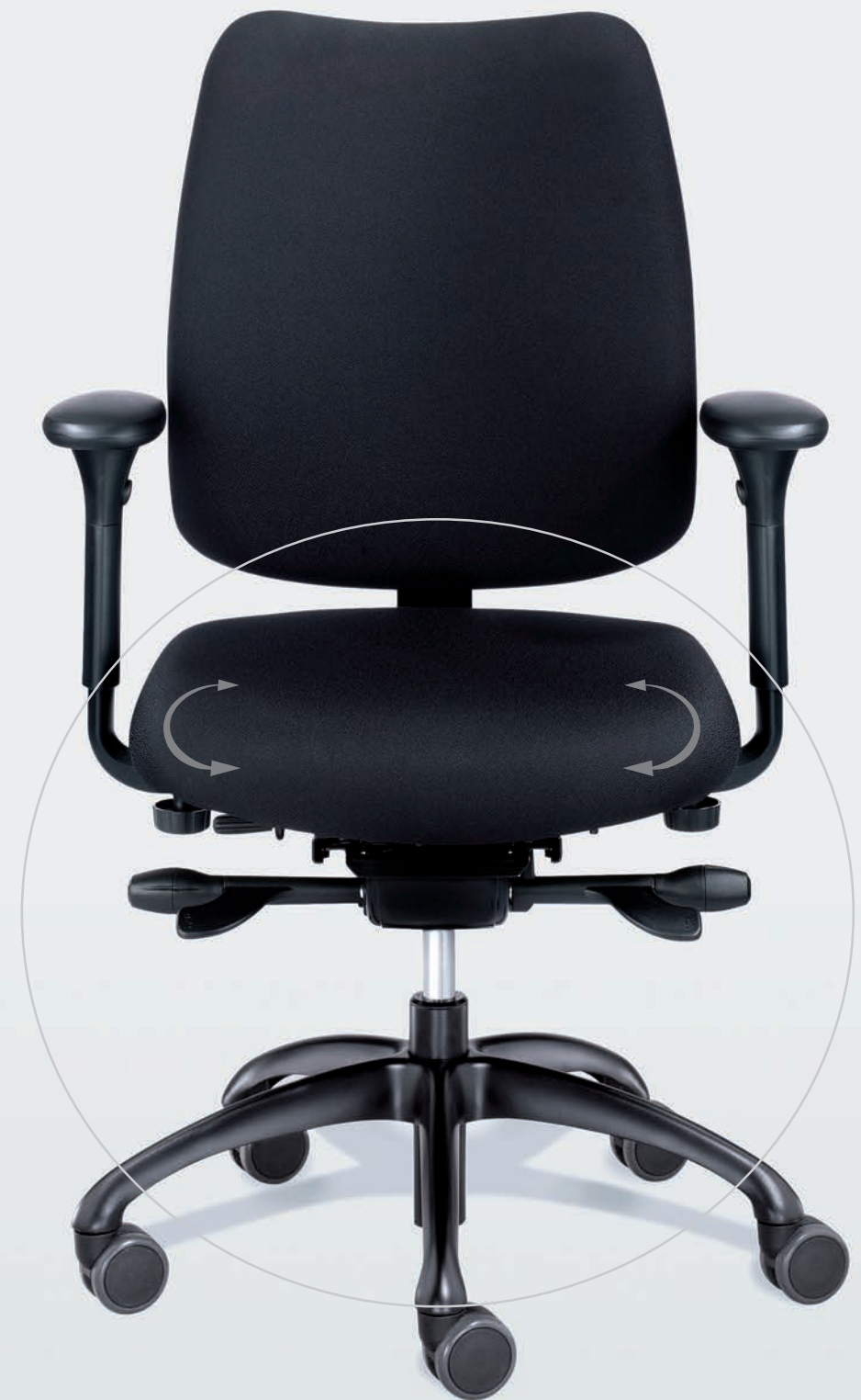
: figo FG 2051, Polster C 280 Cottbus