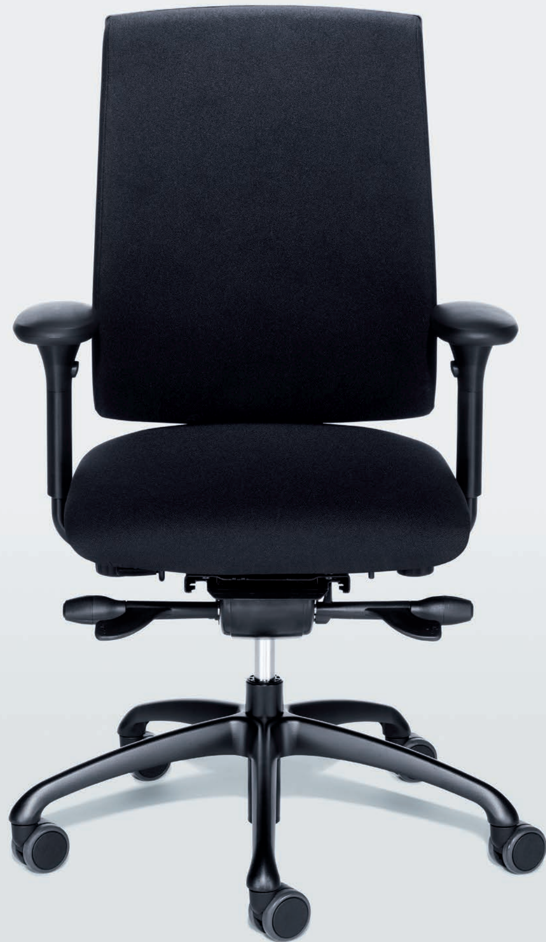
: figo FG 1951, Polster C 280 Cottbus

figo / verbindet Wirtschaftlichkeit mit ergonomischen Qualitäten.