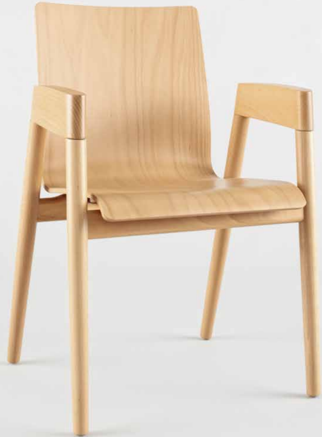
: holzer Sessel HZ 1000, Sitzschale Sichtholz, Buche natur

holzer / für Zuhause, für das Büro und im Restaurant.